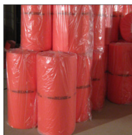
Rollen Recanor op de bouw