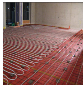
Recanor met vloerverwarming